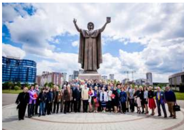
Участники международной научной конференции «Диалог культур в эпоху глобальных рисков», май 2016 г.

На факультете обучаются около 1500 студентов и магистрантов. Ведется и плодотворная научно-исследовательская работа по следующим важнейшим направлениям: философия и методология научного познания; история философской и