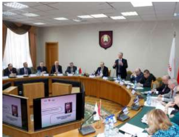
Заседание республиканского научно-практического семинара, организованного Институтом философии НАН Беларуси совместно с РОО «Белая Русь»

Исследования и разработки ученых-гуманитариев Национальной академии наук Беларуси направлены на сохранение и укрепление основ белорусской государственности, социальную консолидацию, обеспечение духовной безопасности и всестороннюю теоретико-методологическую поддержку инновационного пути развития экономики и общества. Они представляют собой уникальный комплекс научных знаний, методов и технологий, в концентрированной форме выражающий традиции и капитал белорусской истории и культуры, важнейшие черты национального самосознания и общественно-государственной идеологии. Это яркое и наглядное выражение государственно-политического суверенитета и культурной субъектности Республики Беларусь, ее места в мировой истории и вклада в копилку глобальной цивилизации.