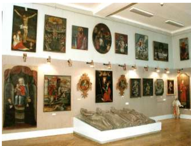
Музей древнебелорусской культуры Центра исследований белорусской культуры, языка и литературы НАН Беларуси

В Институте истории НАН Беларуси издана уникальная двухтомная монография «История белорусской государственности в конце XVIII – начале XXI вв.», в которой проанализированы предпосылки формирования национально-государственной идеи белорусского народа, процесс оформления белорусской государственности, комплексно освещены ее особенности на разных исторических этапах. На основе проработки огромного количества источников из архивов и крупнейших библиотек Беларуси, России, Литвы, Украины, Польши подготовлены и изданы 3 тома многотомного издания «Вялікі гістарычны атлас Беларусі». Проведено первое комплексное исследование истории Полоцка IX – XVIII веков – колыбели белорусской государственности. Оно стало основой фундаментального издания «Полоцк» из серии «Древнейшие города Беларуси». Подготовлен и издан фундаментальный труд «Гісторыя Навагрудка – з глыбінь вякоў да нашых дзён».