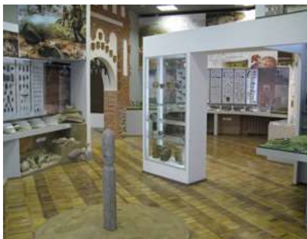
Археологическая научно-музейная экспозиция Института истории НАН Беларуси

Сотрудниками Института истории завершено комплексное исследование многокультурного памятника археологии – городища Обчин Любанского района, являющегося историко-культурной ценностью Республики Беларусь. Эта работа стала основой для реконструкции жизнедеятельности древнего населения Беларуси в позднем бронзовом и раннем железном веках, особенностей материальной и духовной культуры. Проведены комплексные археологические исследования эталонного памятника славянской культуры X – XII вв. у д. Василевщина Дзержинского района. Раскопки, проведенные на площади свыше 20 тыс. м 2 ,