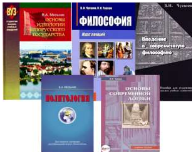
Новейшие издания кафедры

Важнейшим учебно-научным подразделением Института государственной службы Академии управления при Президенте Республики Беларусь является кафедра философских наук и идеологической работы. Миссией кафедры является формирование профессиональных компетенций для эффективного управления духовно-идеологической сферой жизнедеятельности общества. Ее сотрудники ведут преподавание в Институте государственной службы, а также Институте управленческих кадров, магистратуре, аспирантуре. Кафедра является выпускающей по специальностям переподготовки: 1-26 01 79 «Государственное управление и идеология», 1-26 01 79 «Государственная идеология и управление человеческими ресурсами», а также по специальности практикоориентированной магистратуры 1-26 81 15 «Политический анализ и политтехнологии в медиасфере». Среди выпускников кафедры – руководители республиканских и местных органов власти, средств массовой информации, крупных организаций и предприятий в различных секторах хозяйства.