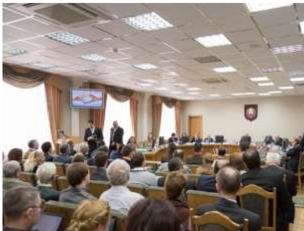
Международная научная конференция по вопросам гуманитарного сотрудничества Беларуси с государствами Латинской Америки, май 2015 г.

гуманитарного диалога и сотрудничества в интересах устойчивого социокультурного развития белорусского общества. Они плодотворно взаимодействуют с Белорусской Православной Церковью и всеми традиционными конфессиями, с крупнейшими общественными организациями, такими как РОО «Белая Русь», Белорусский республиканский союз молодежи и др.