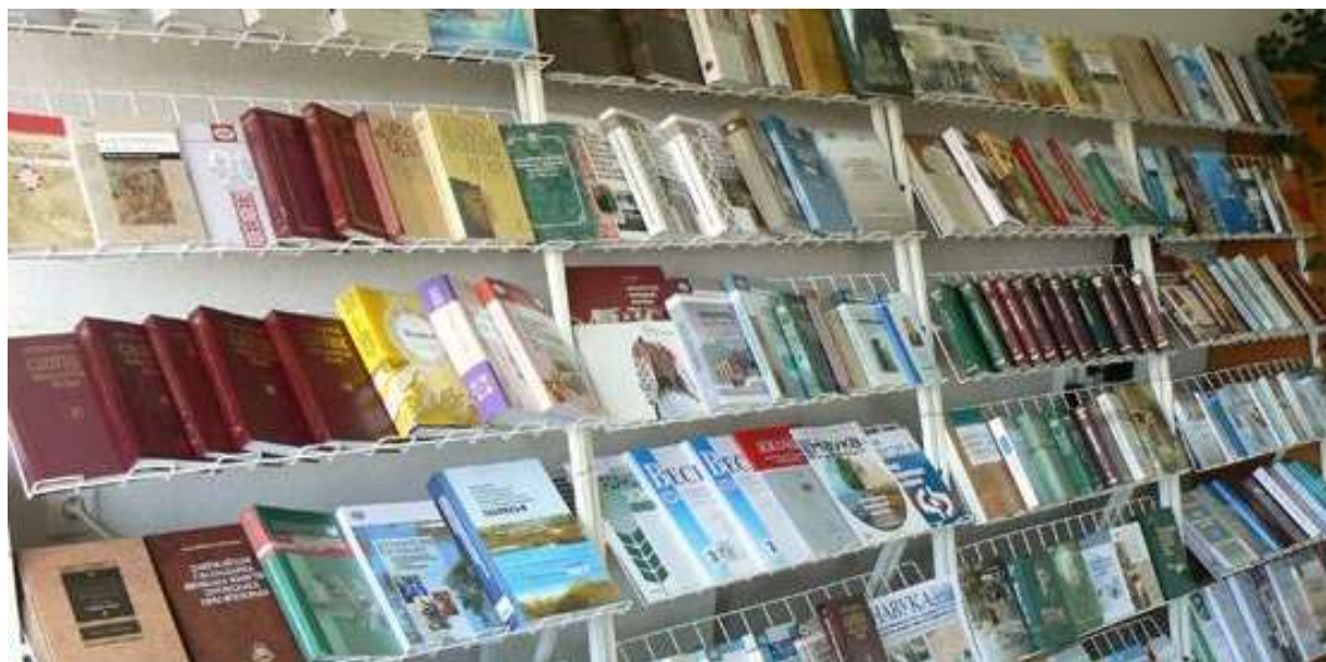
Книги, подготовленные научными учреждениями и коллективами Отделения гуманитарных наук и искусств НАН Беларуси

Отделения удостоены Государственной премии СССР; более 50 человек – Государственной премии БССР и Государственной премии Республики Беларусь в области науки и техники. Академику М. А. Савицкому присвоено звание «Герой Беларуси».