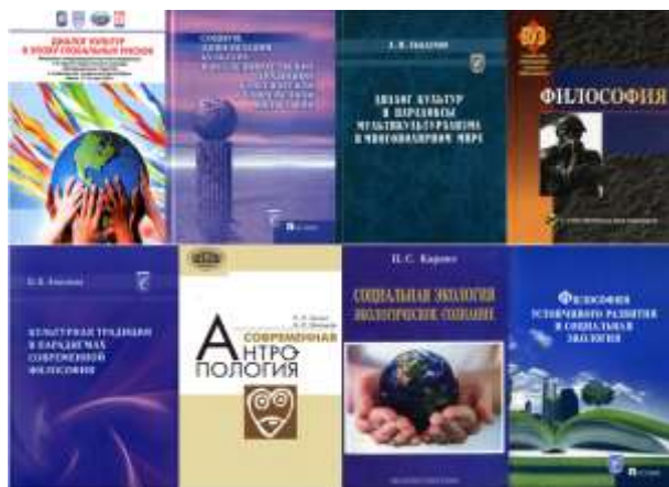
Новейшие издания факультета философии и социальных наук БГУ в области дисциплин философского знания