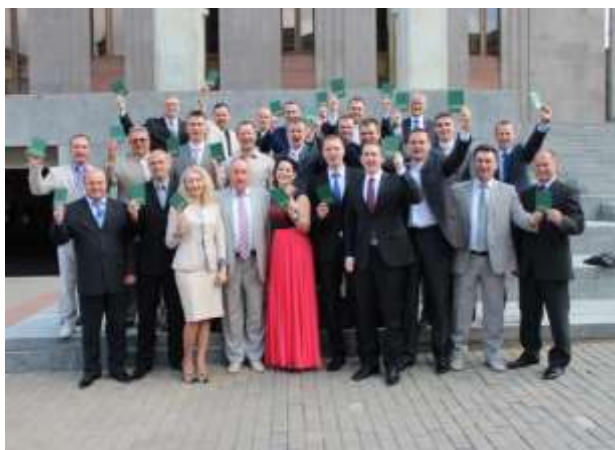
Выпускники кафедры философских наук и идеологической работы Академии управления при Президенте Республики Беларусь

позволяет изучать и внедрять зарубежный опыт в процесс обучения. В списке партнеров академии значатся передовые вузы России, Украины, Китая, Казахстана, Болгарии, Венесуэлы, Кубы, Литвы, Германии, Кыргызстана, Узбекистана, Молдовы, Азербайджана, Сингапура, Чехии, Армении, Польши, Вьетнама. В настоящее время Академией управления подписано 60 соглашений о международном сотрудничестве. Регулярно проводятся совместные конференции, семинары, круглые столы, осуществляются научные работы в области государственного управления.