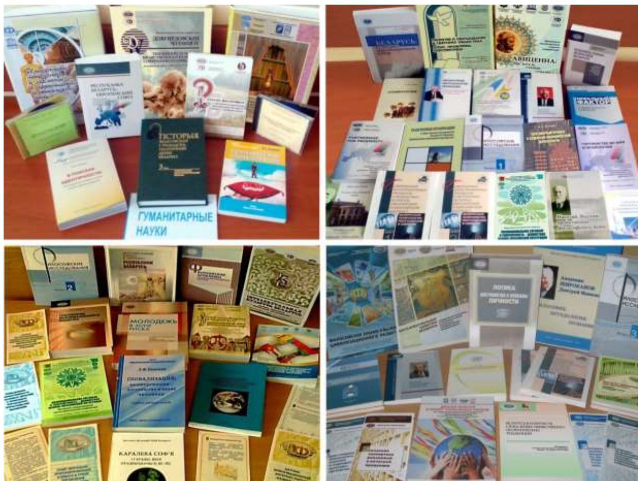
Издания Института философии НАН Беларуси, 2013–2016 гг.

интеллектуальная культура, нашедшая концентрированное выражение в философской мысли Беларуси. Впервые для мирового сообщества системно и целостно изложено становление и развитие философской мысли Беларуси как культуротворческий процесс. Введены в научный оборот либо существенно расширены представления о философском творчестве Кирилла Туровского, Ф. Скорины, С. Будного, К. Лыщинского, М. Смотрицкого, И. Иевлевича, Я. Снядзецкого, С. Маймона, А. Довгирда и десятков других имен. Изданы 1-й – 4-й тома фундаментальной «Истории философской и общественно-политической мысли Беларуси», 1-й том «Истории эстетической мысли Беларуси», монографии, посвященные отдельным эпохам и выдающимся фигурам интеллектуальной истории страны.